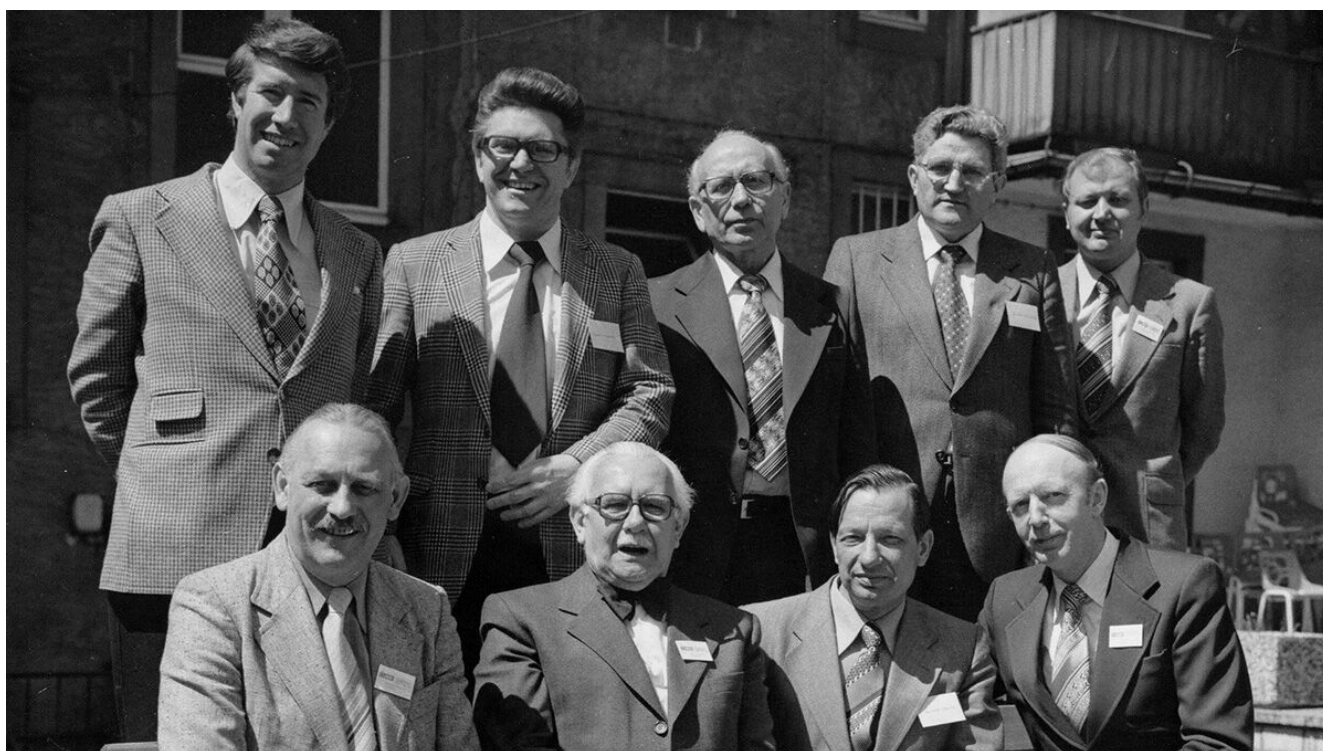
Leitung der ACD von 1976 bis 1980 (undatiert)