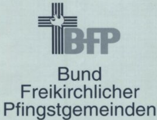
Logo "BFP" - 1980iger Jahren (Bild: BFP-Archiv, undatiert)