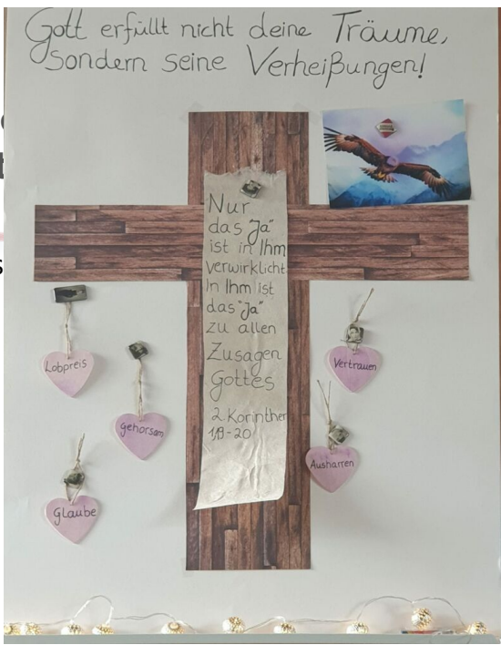
Thema der Frauenimpulstage 2023

Gott erfüllt nicht deine Träume, sondern seine Verheißungen!