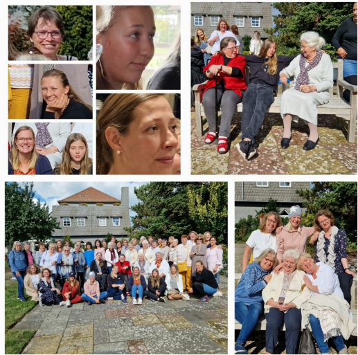
Drei Generationen, Altersunterschiede, alle Teilnehmerinnen