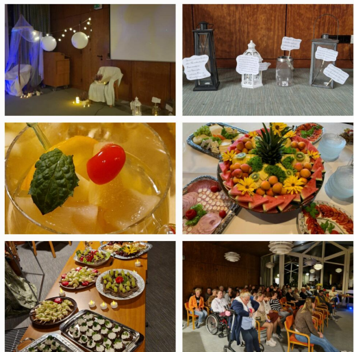
Impressionen von den Impulstage in Lemförde