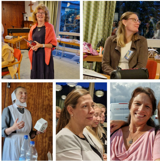
Impulstage in Lemförde